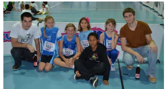
Certains parlent déjà de la stratégie à adopter pour la suite de l'aventure et d'autres pour l'année prochaine !