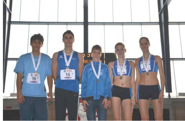
Après toutes ces émotions et 3 médailles sierroises